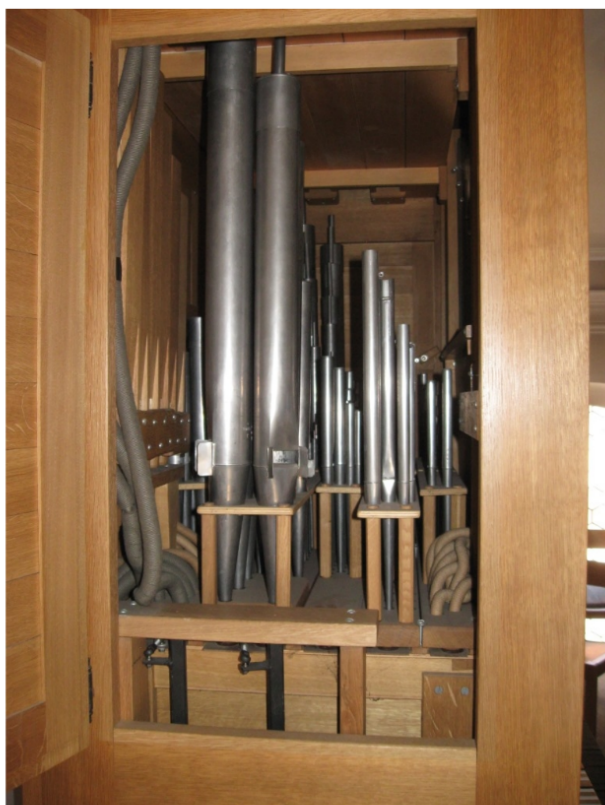
Müswangen, St. Mariä Himmelfahrt