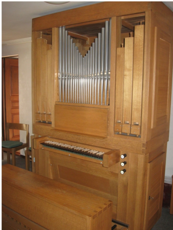
Müswangen, St. Mariä Himmelfahrt