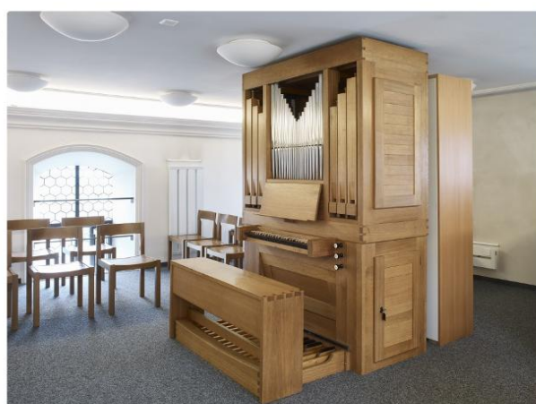
Müswangen, St. Mariä Himmelfahrt

Lustenberger, Otto Kirchenchöre und Orgeln. Ein Beitrag zur Geschichte der Kirchenmusik im Kanton Luzern Brunner, Kriens 1997 S. 215