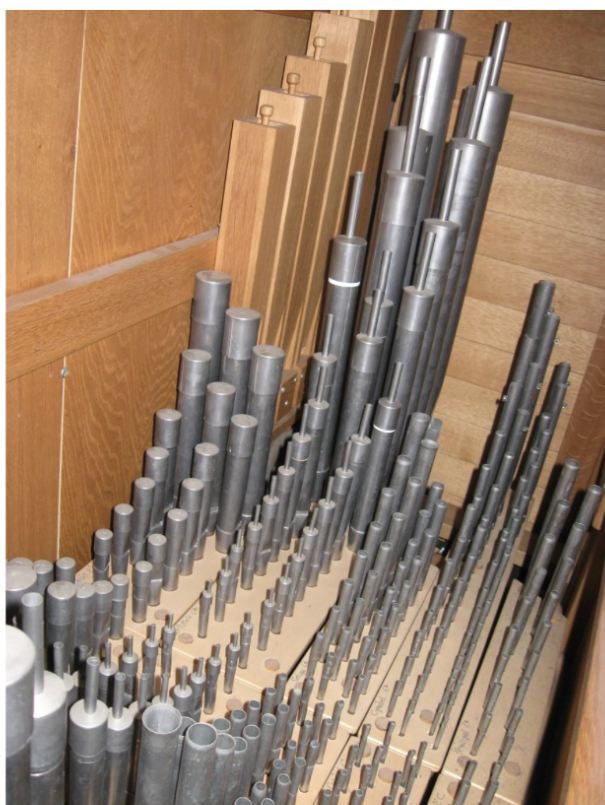
Müswangen, St. Mariä Himmelfahrt