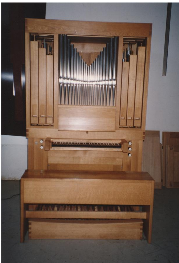
Müswangen, St. Mariä Himmelfahrt